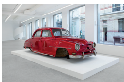
Aronde, 2023 Épave automobile et techniques mixtes · Car wreck and mixed media Sans socle · Without Plinth : 154 x 400 x 135 cm Socle · Plinth : 15 x 500 x 240 cm