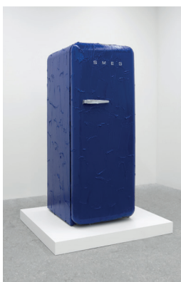
Smeg, 2023 Peinture acrylique sur réfrigérateur · Acrylic paint on refrigerator Sans socle · Without Plinth : 154 x 61 x 77 cm Socle · Plinth : 110 x 110 x 10 cm